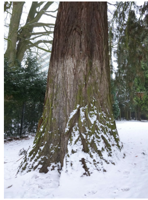
, 18 Januari 2013