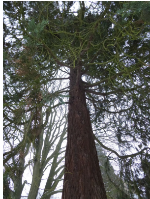
, 18 Januari 2013