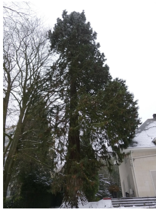
, 18 Januari 2013