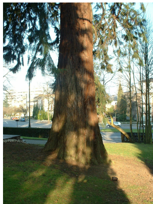
, 13 February 2003