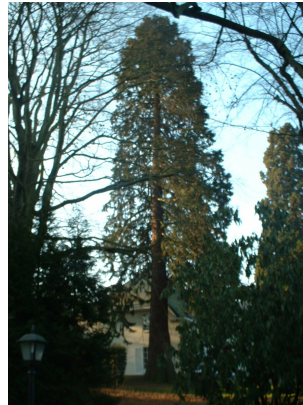
, 13 February 2003