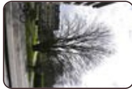
Gewone esdoorn Evere Henry Dunantlaan