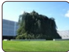
Treurbeuk Evere Leuvensesteenw eg, 862