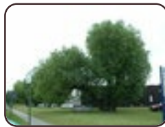
Kraakwilg Evere Straatsburgstra t