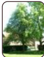
Gewone of wilde lijsterbes Evere Tornooiveld wijk Riddervaanlaan