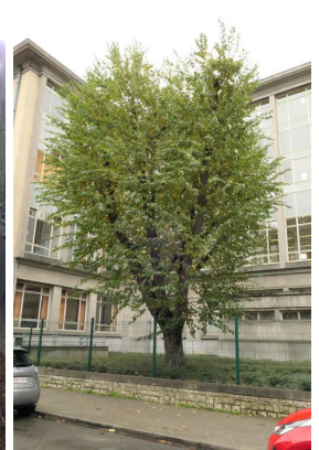
Ostrya carpinifolia ,