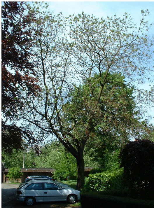
rompetboom, Park van het Sint-Michielscollege