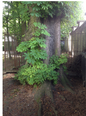
Witte paardenkastanje, Jean Felix Haptuin