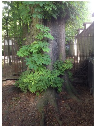
Marronnier commun, Jardin Jean Félix Hap