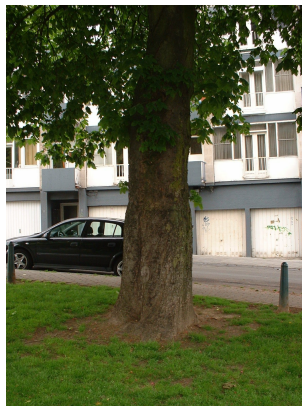
Marronnier à fleurs rouges,