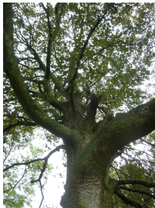
, 17 Oktober 2013