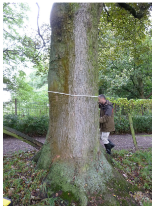
, 17 Oktober 2013