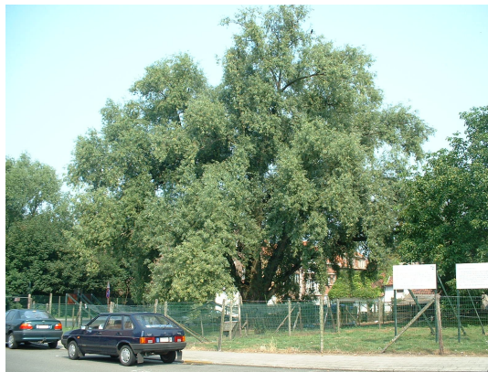
, 05 Août 2003