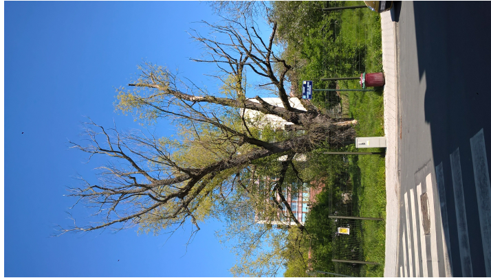
, 19 Juin 2020