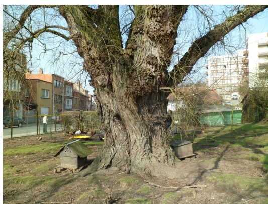
, 14 Mars 2012