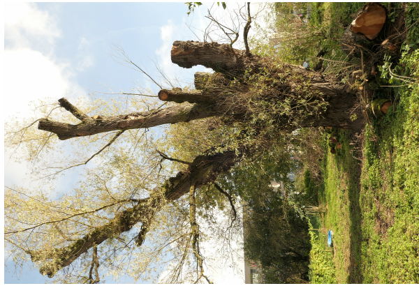
, 08 Novembre 2021