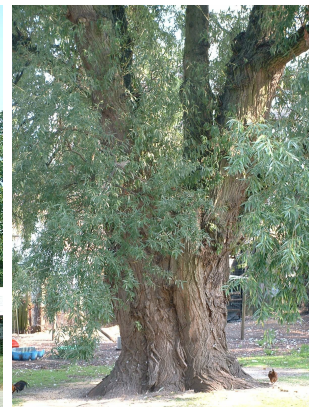
, 05 Août 2003