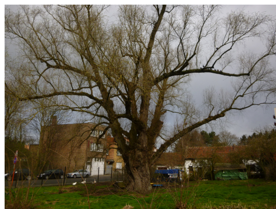
, 31 Mars 2015