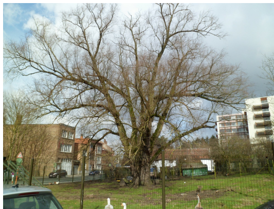
, 14 Mars 2012