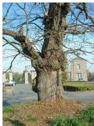
, 09 April 2003