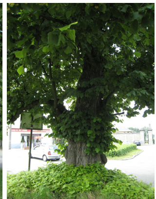
, 10 Juni 2008