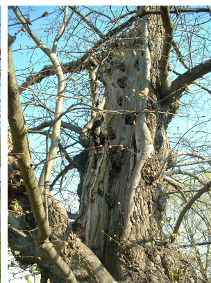
, 09 April 2003