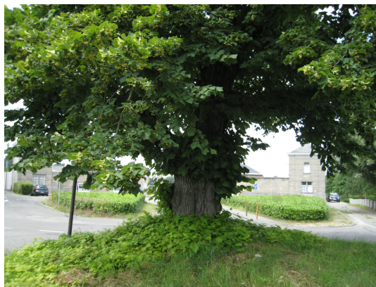
, 10 Juni 2008