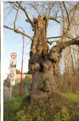
, 22 Januari 2021