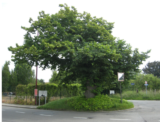
, 10 Juni 2008