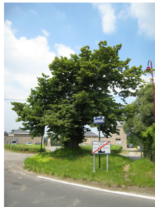
, 10 Juni 2008