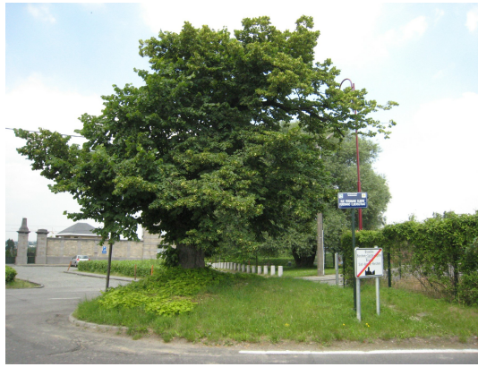
, 10 Juni 2008