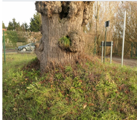
, 22 Januari 2021

* Deze criteria worden gewogen op de wijze als omschreven in de methodologie .