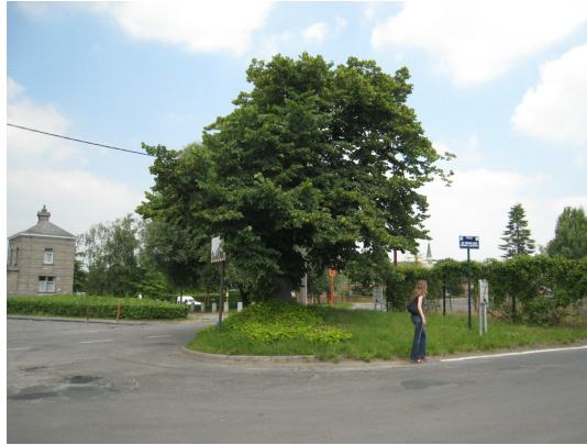
, 10 Juni 2008