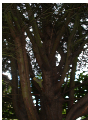
, 11 Septembre 2003