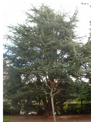
, 11 Septembre 2003