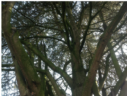
, 28 Août 2013