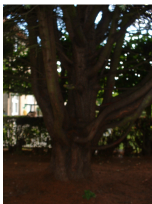
, 11 Septembre 2003