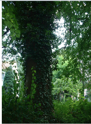
, 19 Juli 2002