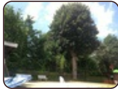
Acer pseudoplatanus 'Purpurascens' Berchem-Sainte- Agathe Avenue de la Basilique, 14