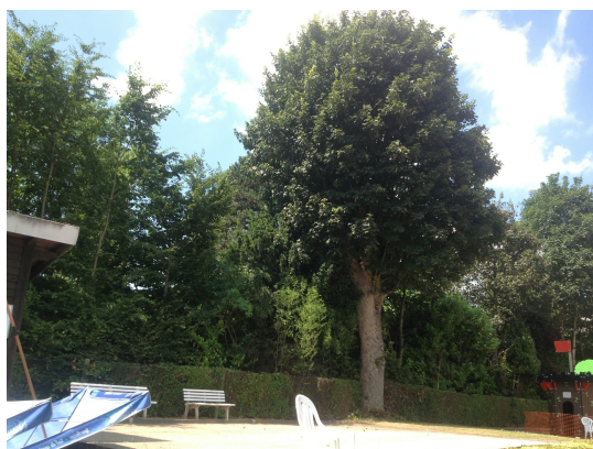
Acer pseudoplatanus 'Purpurascens',