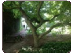
Magnolia sp Berchem-Sainte- Agathe Avenue René Comhaire, 59