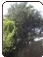
Cèdre de l'Himalaya Berchem-Sainte- Agathe Avenue de la Basilique, 14