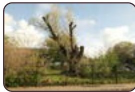
Saule blanc Berchem-Sainte- Agathe Sentier du Broek