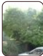
Magnolia sp Berchem-Sainte- Agathe Rue Openveld, 90-92