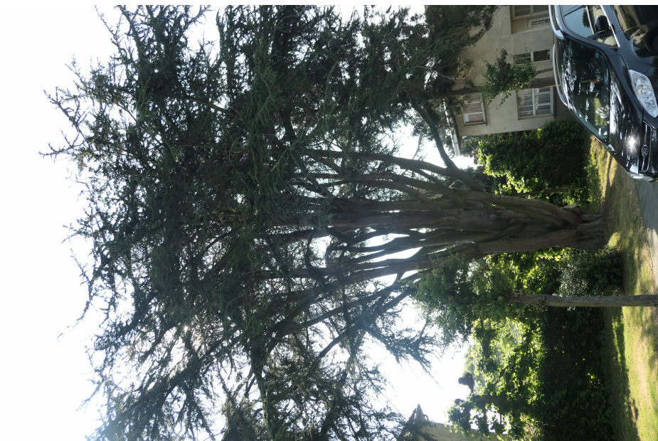
Cèdre de l'Atlas,