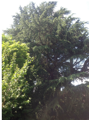
Cèdre de l'Himalaya,