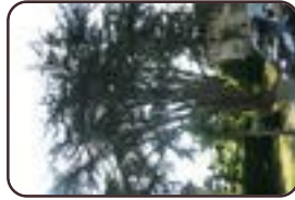
Cèdre de l'Atlas Berchem-Sainte- Agathe Rue de Termonde