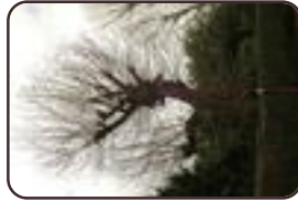
Erable à feuilles de frêne Berchem-Sainte- Agathe Avenue de la Basilique