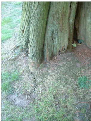
, 30 August 2005