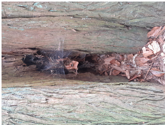
, 14 Maart 2022