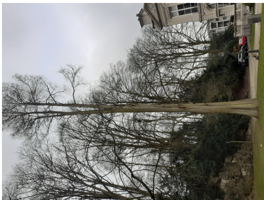
, 14 Maart 2022