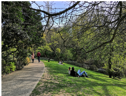
Tenboschpark, April 2021