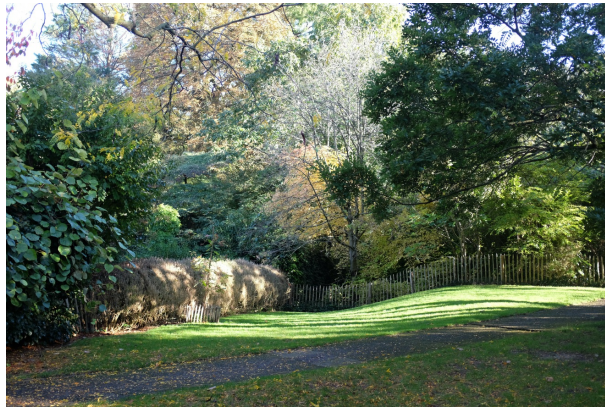
Tenboschpark, Oktober 2023