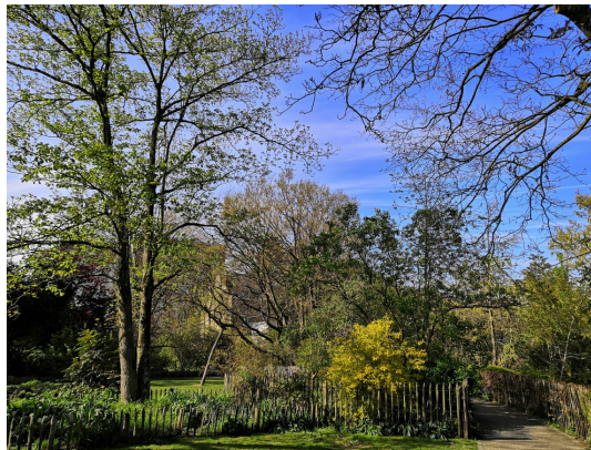
Tenboschpark, April 2021