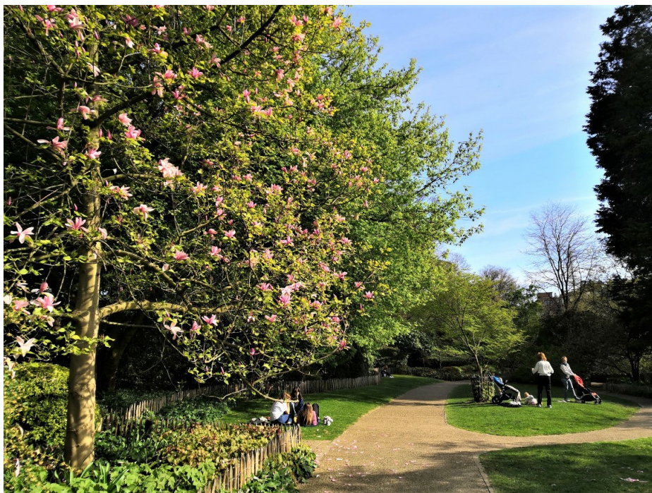
Tenboschpark, April 2021