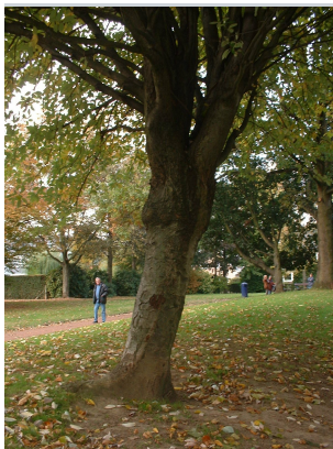
, 22 Oktober 2003

XLSX (Excel 2007) - XLS (Excel 1997-2003) .