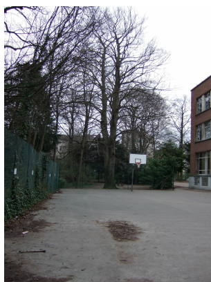
Hêtre d'Europe, Ancienne propriété Lindthout