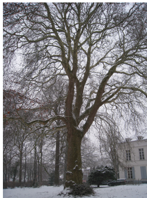
Platane d'Orient, Propriété Voot