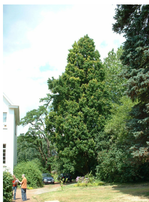
Chêne pédonculé fastigié,