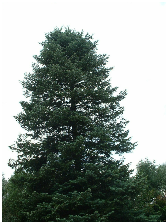
Sapin du Colorado,