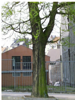
Ginkgo biloba 'Fastigiata', Huart Hamoirlaan en Rigasquare