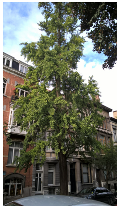
Ginkgo biloba 'Fastigiata', Huart Hamoirlaan en Rigasquare