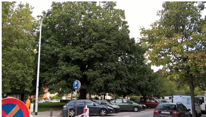
Kaukasische vleugelnoot, Huart Hamoirlaan en Rigasquare