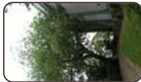
Zwarte moerbe Sint-Joost-Ten- Node Kruidtuinpark