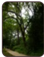
Fraxinus 'Charles Bommer' Sint-Joost-Ten- Node Kruidtuinpark