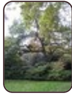
Quercus acutissima Sint-Joost-Ten- Node Kruidtuinpark