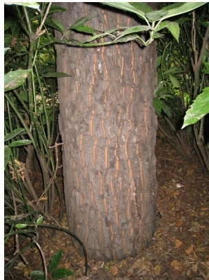
Quercus acutissima, Kruidtuinpark