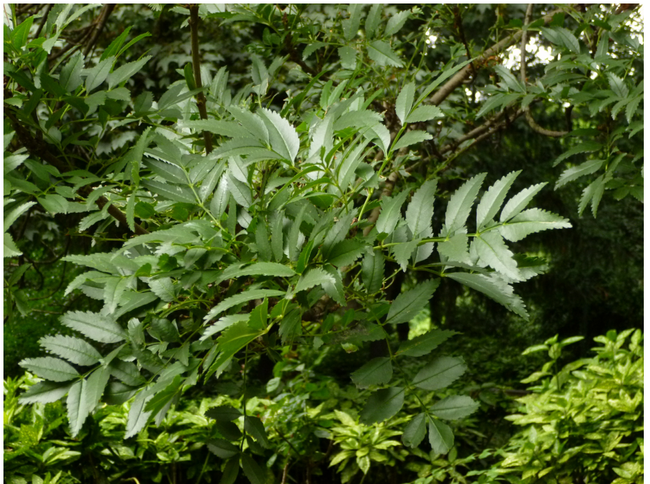
Fraxinus 'Charles Bommer', Kruidtuinpark