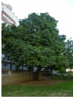
Aesculus flava, Armand Steurssquare