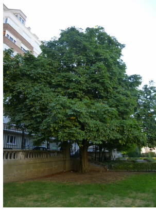
Marronnier jaune, Square Armand Steurs