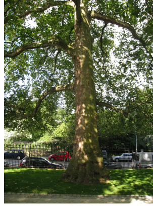
Platane à feuille d'érable, Jardin Botanique