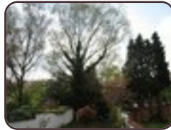
Zachte berk Sint-Jans- Molenbeek Tuin van het Durieu huis Frisheidstraat, 26