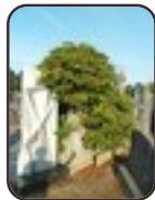
Rhododendron sp. Sint-Jans- Molenbeek Begraafplaats van Sint-Jans- Molenbeek Gentsesteenweg , 535