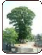
Acer pseudoplatanus 'Erectum' Sint-Jans- Molenbeek Begraafplaats van Sint-Jans- Molenbeek