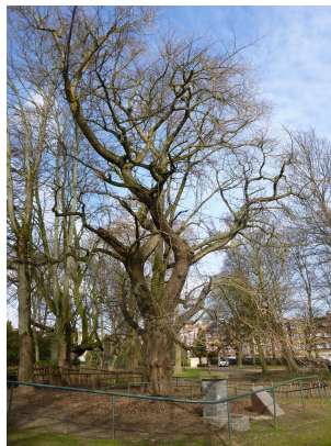
Japanse notenboom, Muzenpark