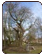
Japanse notenboom Sint-Jans- Molenbeek Muzenpark