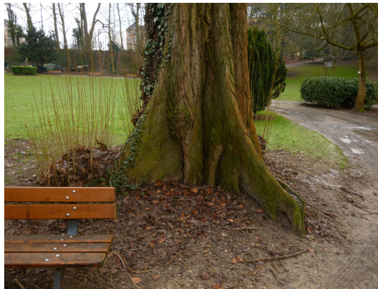
Italiaanse populier, Marie-Josépark

Prunus x syriaca 'Rubescens' St.- Jans - Molenbeek Ferdinand Elbersstraat, 20