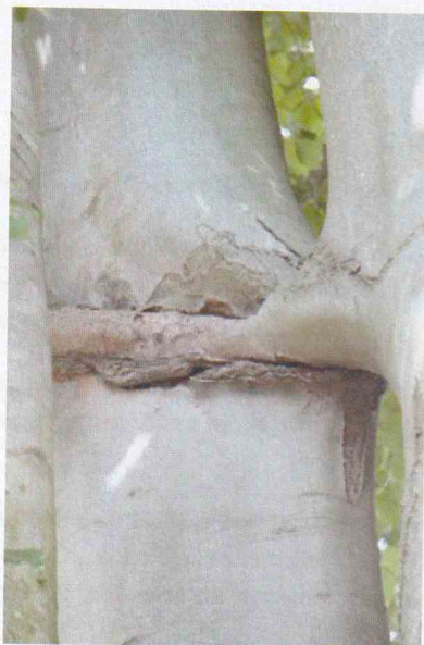
FIGURE 10 : BRANCHE NON-ELAGUEE ; LE POURTOUR DE LA BRANCHE EST ATTEINT DE CHANCRE ET LA CICATRISATION IMPOSSIBLE.