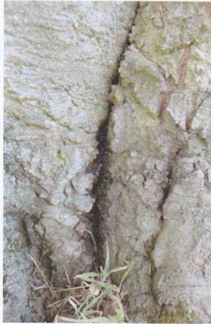
FIGURE 4 : NECROSES DU TRONC A SON COLLET