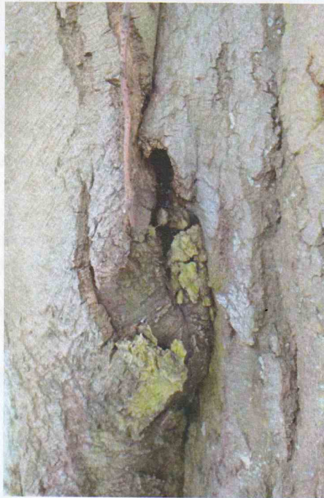
FIGURE 7 : SUINTEMENT ET POURRITURE A LA JONCTION DE DEUX TRONCS