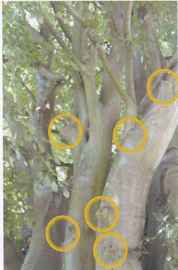
FIGURE 9 : ARCHITECTURE DE L'ARBRE AVEC BRANCHES NON-ELAGUEES