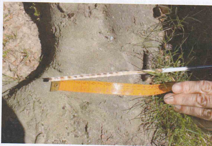
FIGURE 11 : CAROTTE PRELEVEE A LA TARIERE DE PRESSLER

Deux sondages à la tarière de Pressler sur 25 cm de profondeur sous les zones de décollement d'écorce ont révélé des débuts de pourriture dans les premiers centimètres sous l'assise cambiale.