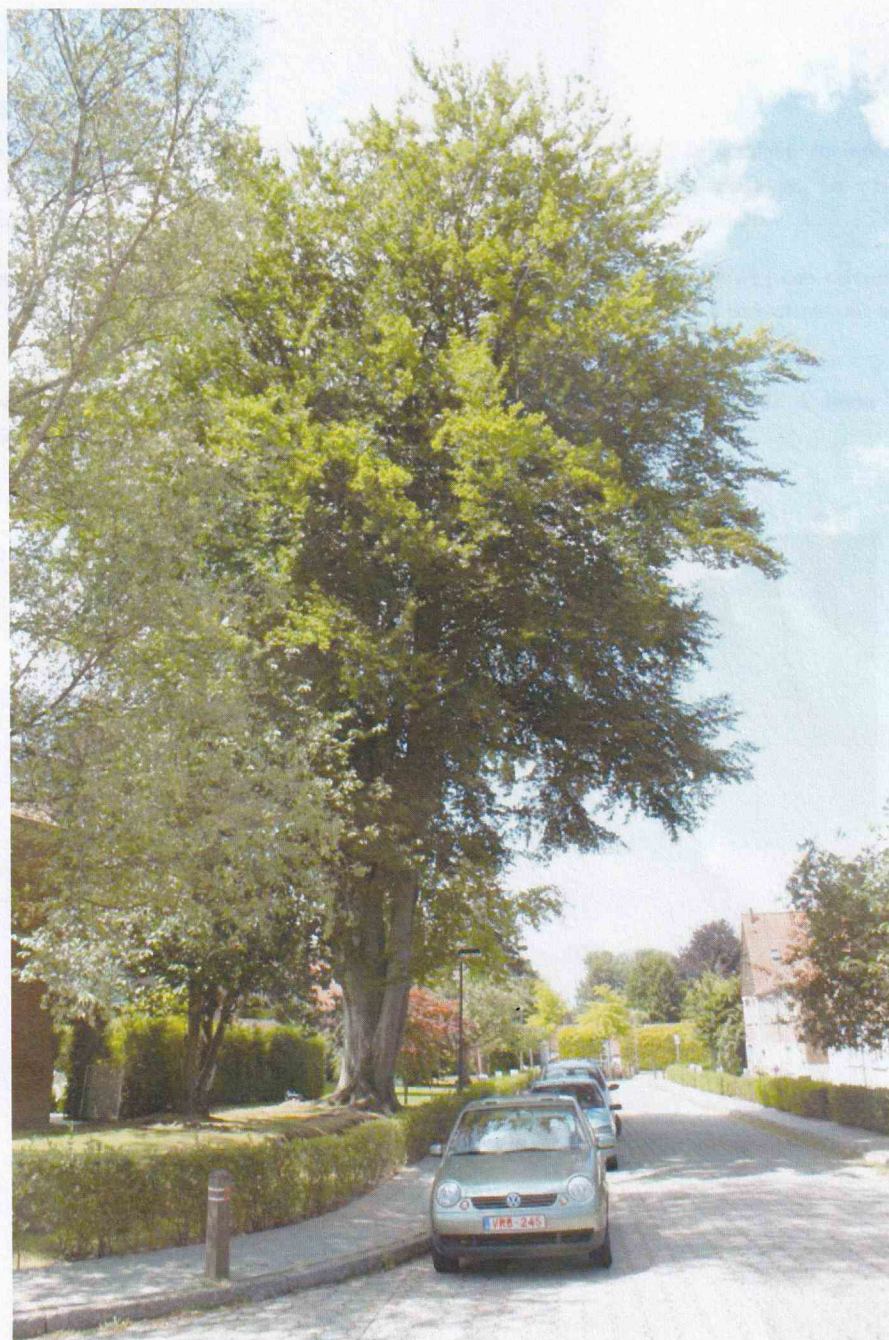
ELEMENTS DE DIAGNOSTIC FIGURE 1 : SILHOUETTE GENERALE