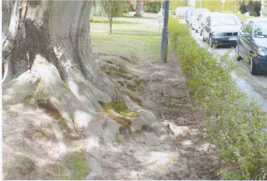
FIGURE 3 : SYSTEME RACINAIRE MIS A NUS PAR L'EROSION EN BORDURE DE FOSSE