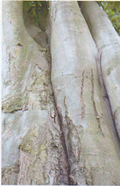
FIGURE 6 : JONCTIONS IMPARFAITES ENTRE LES TRONCS