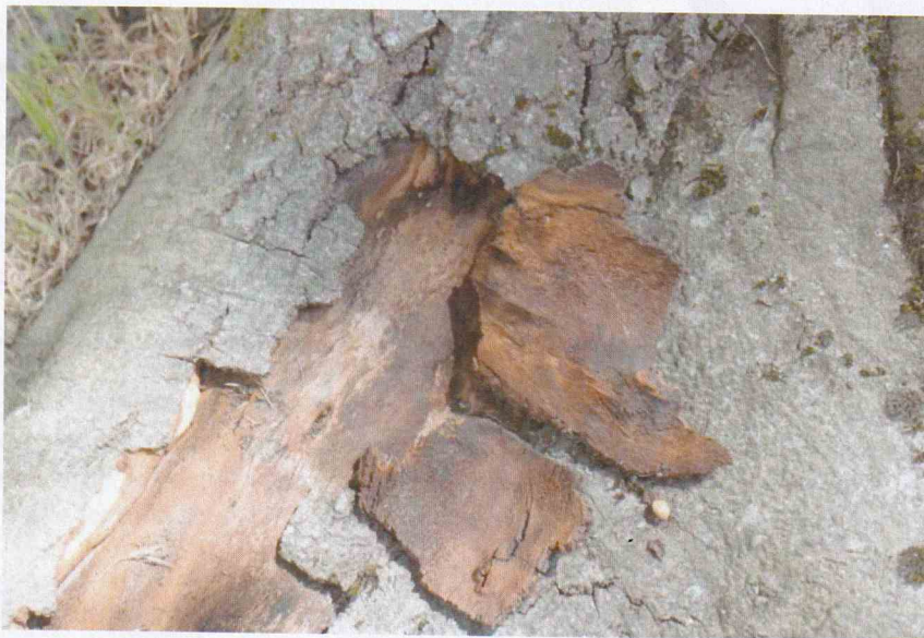
FIGURE 2 : DECOLLEMENTS D'ECORCE SUR PLUSIEURS RACINES CHARPENTIERES

Enfin, la voirie a probablement accentué le stress racinaire en limitant l'accès à l'eau et l'espace d'exploration des racines.