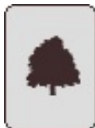
Robinia pseudoacacia 'Coluteoides' Vorst Park van Vorst