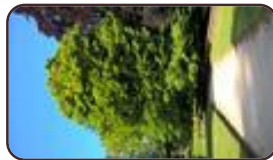
Fagus sylvatica 'Laciniata' Vorst Dudenpark