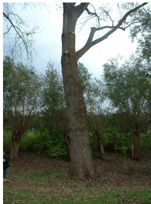
Canadese populier, Park van Bempt