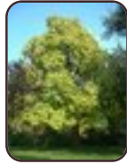
rompetboom Vorst Park van Vorst