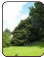
Varenbeuk Vorst Besmelaan, 22