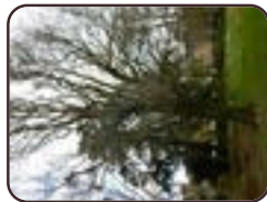
Quercus robur 'Tortuosa' Vorst Abdij van Vorst