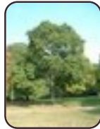
Hybride notelaar Vorst Park van Vorst