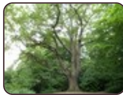
Zomereik Vorst Jacques Brel park Kersbeeklaan