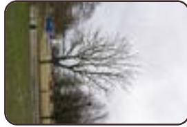
Doodsbeendere nboom Vorst Park van Vorst