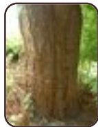
Trompetboom Vorst Brusselse Steenweg, 150