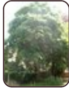
Kolchische Esdoorn Vorst Brugmannlaan, 118