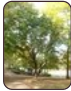
Acer monspessulanu m Vorst Park van Vorst