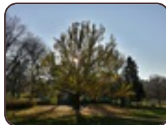
Amberboom Vorst Park van Vorst