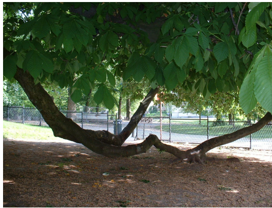
, 21 Mai 2002