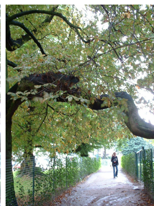
, 28 Août 2006