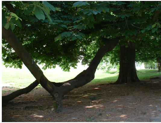
, 21 Mai 2002