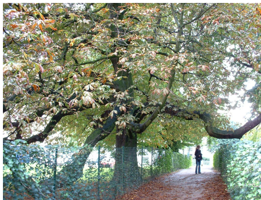
, 28 Août 2006