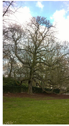
, 01 Avril 2016