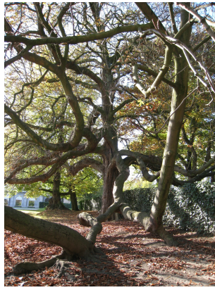
, 15 Octobre 2009