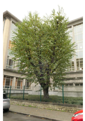
Ostrya carpinifolia ,