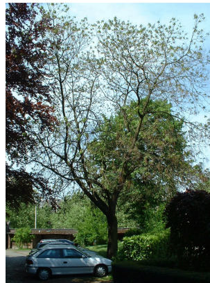
rompetboom, Park van het Sint-Michielskollege