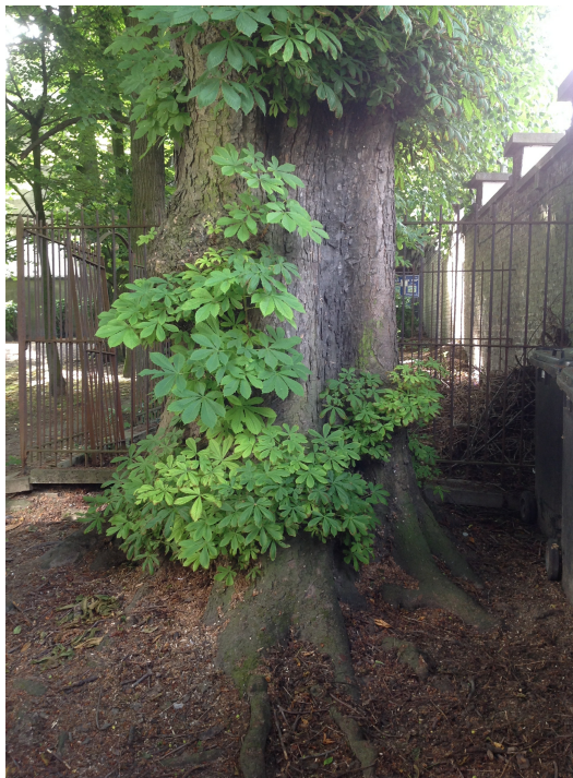
Witte paardenkastanje, Jean Felix Haptuin