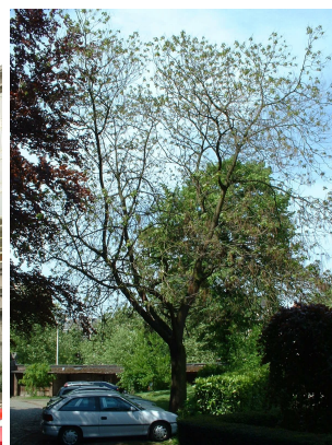
Catalpa rougeâtre, Parc du collège Saint-Michel