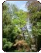
Catalpa rougeâtre Etterbeek Jardin Jean Félix Hap