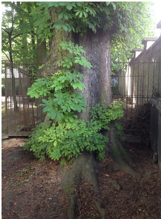
Marronnier commun, Jardin Jean Félix Hap