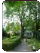
Ailante glanduleux Etterbeek Rue Charles De Buck, 23