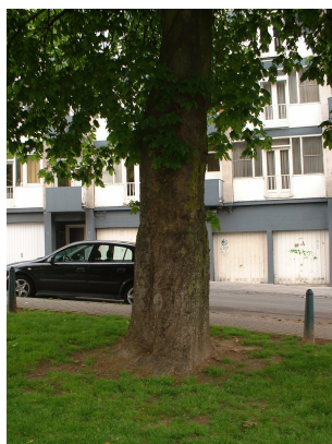
Marronnier à fleurs rouges,