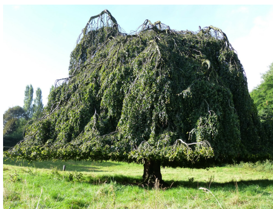
, 11 Septembre 2013