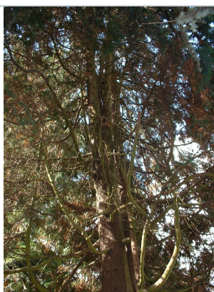
, 11 September 2003