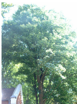
, 30 Août 2005