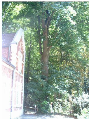
, 30 Août 2005