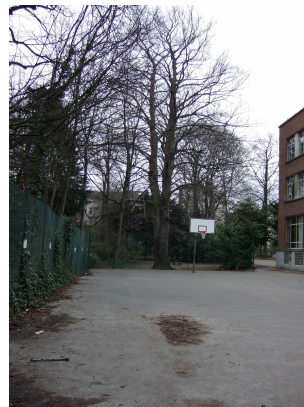
Hêtre d'Europe, Ancienne propriété Lindthout