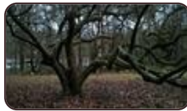
Magnolier de Soulange Woluwé-Saint- Lambert Moulin de Lindekemaële et abords Avenue Jean- François Debecker, 48