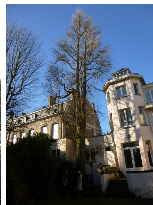
Arbre aux quarante écus,