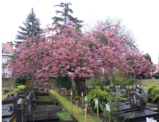
Cerisier du Japon,