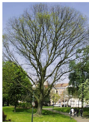
Fraxinus biltmoreana, Huart Hamoiriaan en Rigasquare