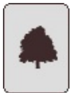
Prunus cerasus Schaarbeek Josaphatpark Generaal Eisenhowerlaan