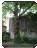
Gewone plataan Schaarbeek Koninginnelaan, 141