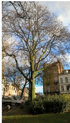
Acer platanooides f. rubrum, Weldoensplein