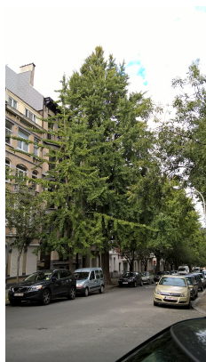
Ginkgo biloba 'Fastigiata', Huart Hamoiriaan en Rigasquare