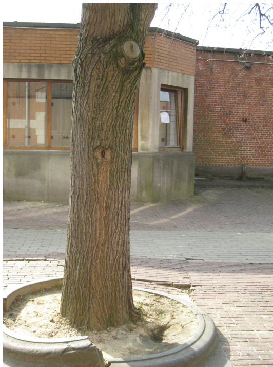
Ulmus glabra 'Pendula',