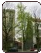
Ginkgo biloba 'Fastigiata' Schaarbeek Huart Hamoirlaan en Rigasquare Huart Hamoirlaan