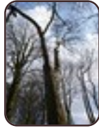
Cedrela sinensis Schaarbeek Josaphatpark