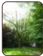
Vogelkers Schaarbeek Kolonel Bourgstraat