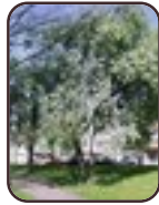
Sorbus aria f. lutescens Schaarbeek Huart Hamoirlaan en Rigasquare Huart Hamoirlaan