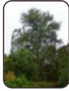
Canadese populier Schaarbeek Josaphatpark