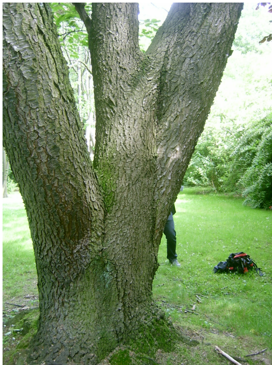
Cerisier à grappes,