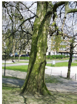
Platane à feuille d'érable, Avenue Huart Hamoir et Square Riga