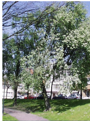
Sorbus aria f. lutescens, Avenue Huart Hamoir et Square Riga