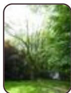
Cerisier à grappes Schaerbeek Rue Colonel Bourg