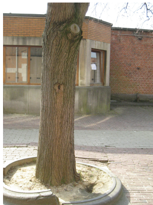
Ulmus glabra 'Pendula',