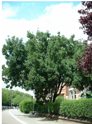
Osmanthe de Burkwood,