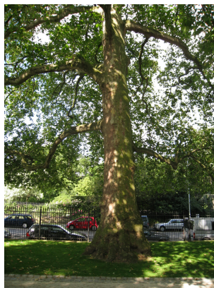
Gewone plataan, Kruidtuinpark