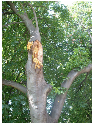
Rode paardenkastanje, Armand Steurssquare