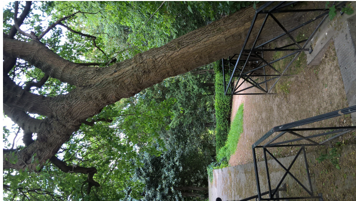
Zwarte moerbei, Kruidtuinpark