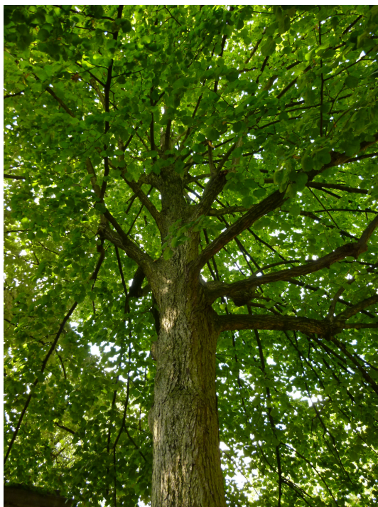
Tilleul à petites feuilles, Square Armand Steurs