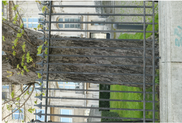
Marronnier à fleurs rouges,