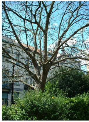
Catalpa rougeâtre, Square Armand Steurs