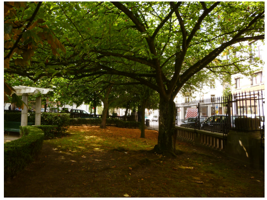
Cerisier du Japon, Square Armand Steurs